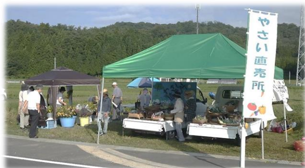
△ 昨年8月11日の軽トラ朝市の様子 京丹後大宮IC付近で